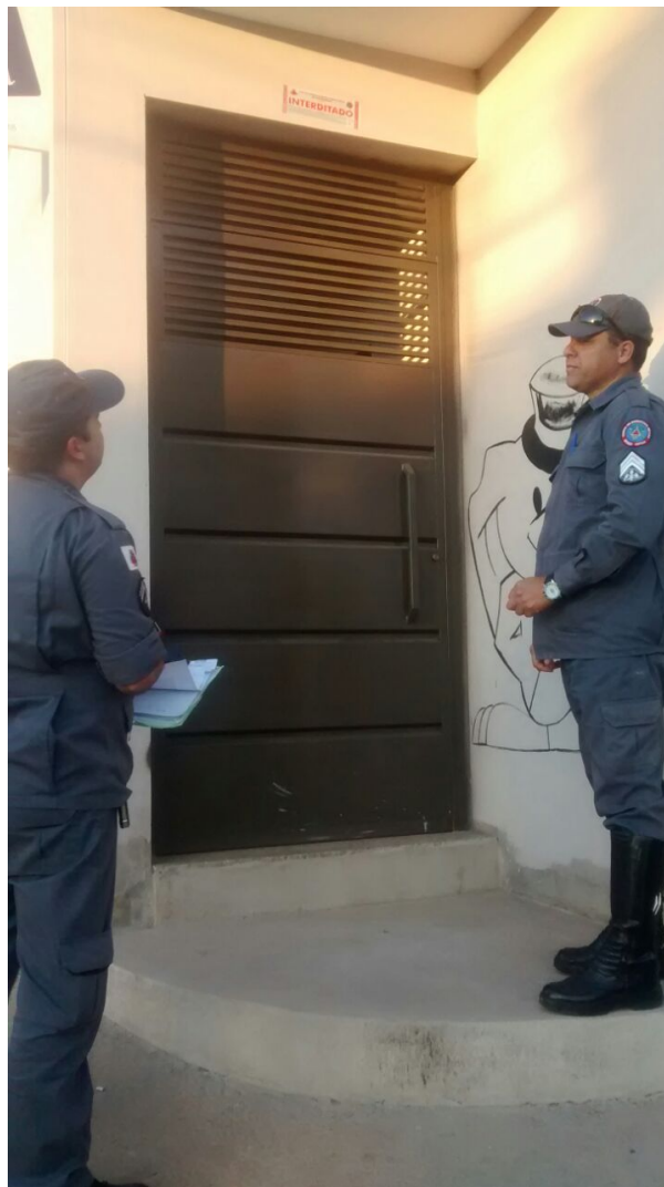
https://foconoticia.com.br/noticia/276/bombeiros-realizam-operacao-alerta-vermelho em 04/07/2024 03:22