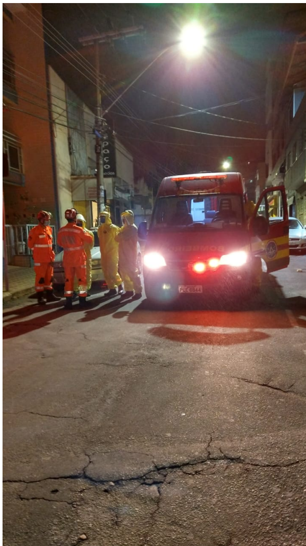
https://foconoticia.com.br/noticia/5749/pacientes-do-hospital-de-campanha-em-lafaiete-sao-transferidos-apos-obra-a-lado-desabar em 05/07/2024 15:28