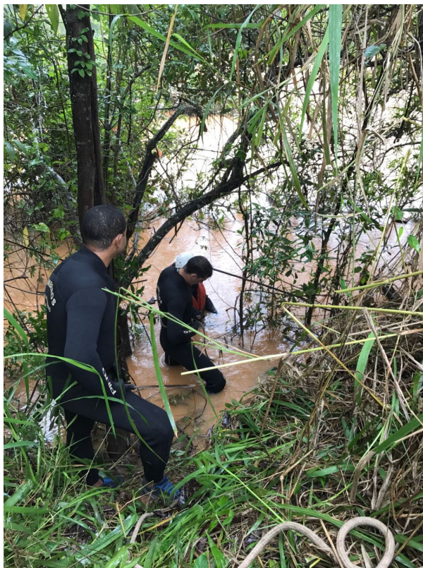
https://foconoticia.com.br/noticia/595/bombeiros-salvam-cavalos-ilhados-em-gage em 05/07/2024 10:21